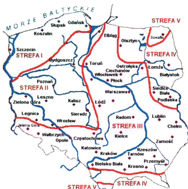
Rys. 1 Strefy klimatyczne Polski i temperatury obliczeniowe

Położenie obiektu, w którym planowany jest montaż, na mapie ma wpływ na pracę instalacji. W zależności od współrzędnych geograficznych rozbieżności w temperaturach projektowych mogą mieć znaczącą wartość. W skali kraju ilustruje to poniższa mapa (Rys.1).